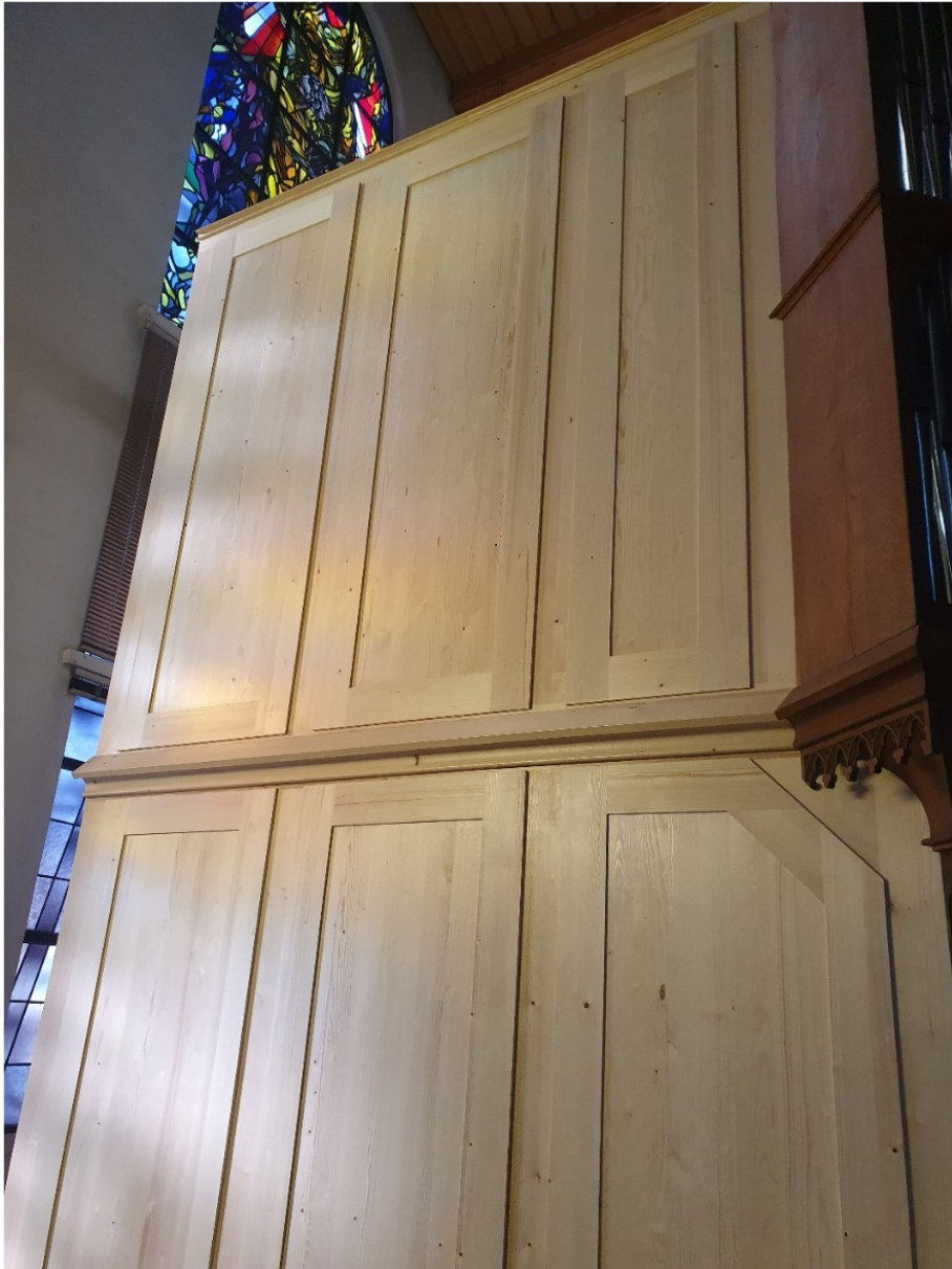
Fertigstellung des rekonstruierten Hintergehäuses