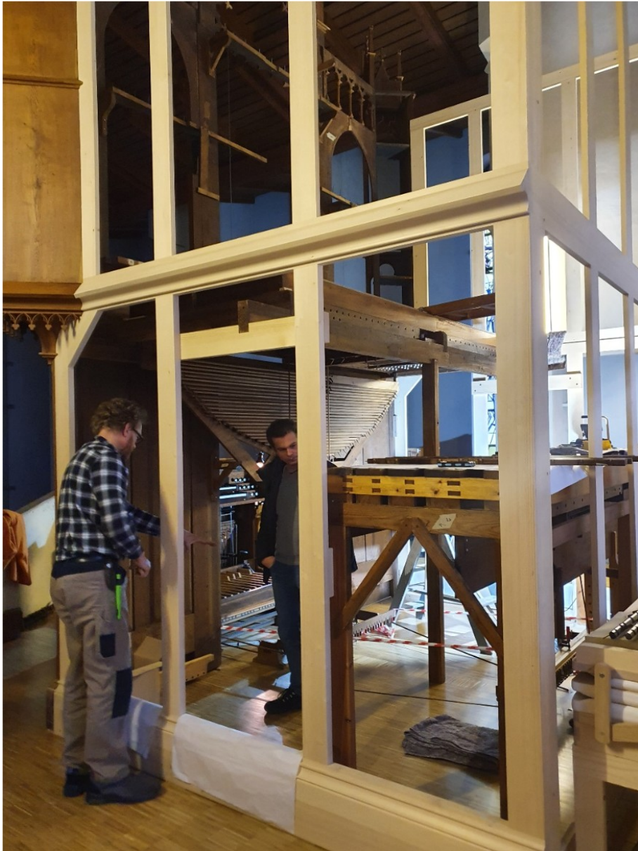
Wiedereinbau der restaurierten Windladen