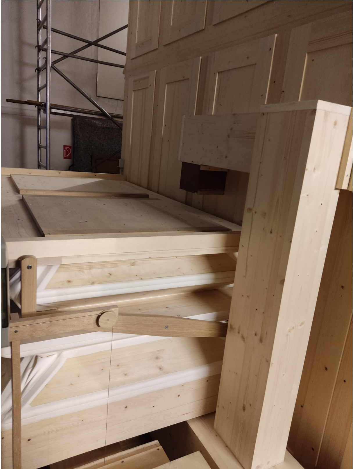
Einbau der rekonstruierten Balganlage hinter der Orgel