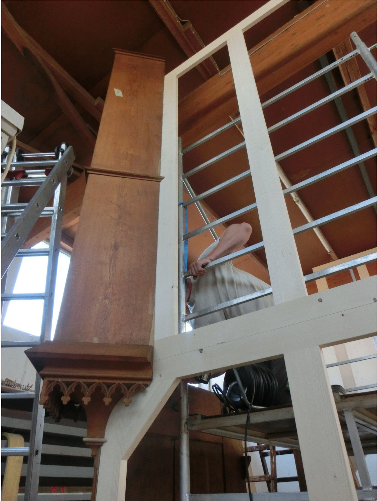
Vormontage des Orgelgehäuses in der Orgelbauwerkstatt