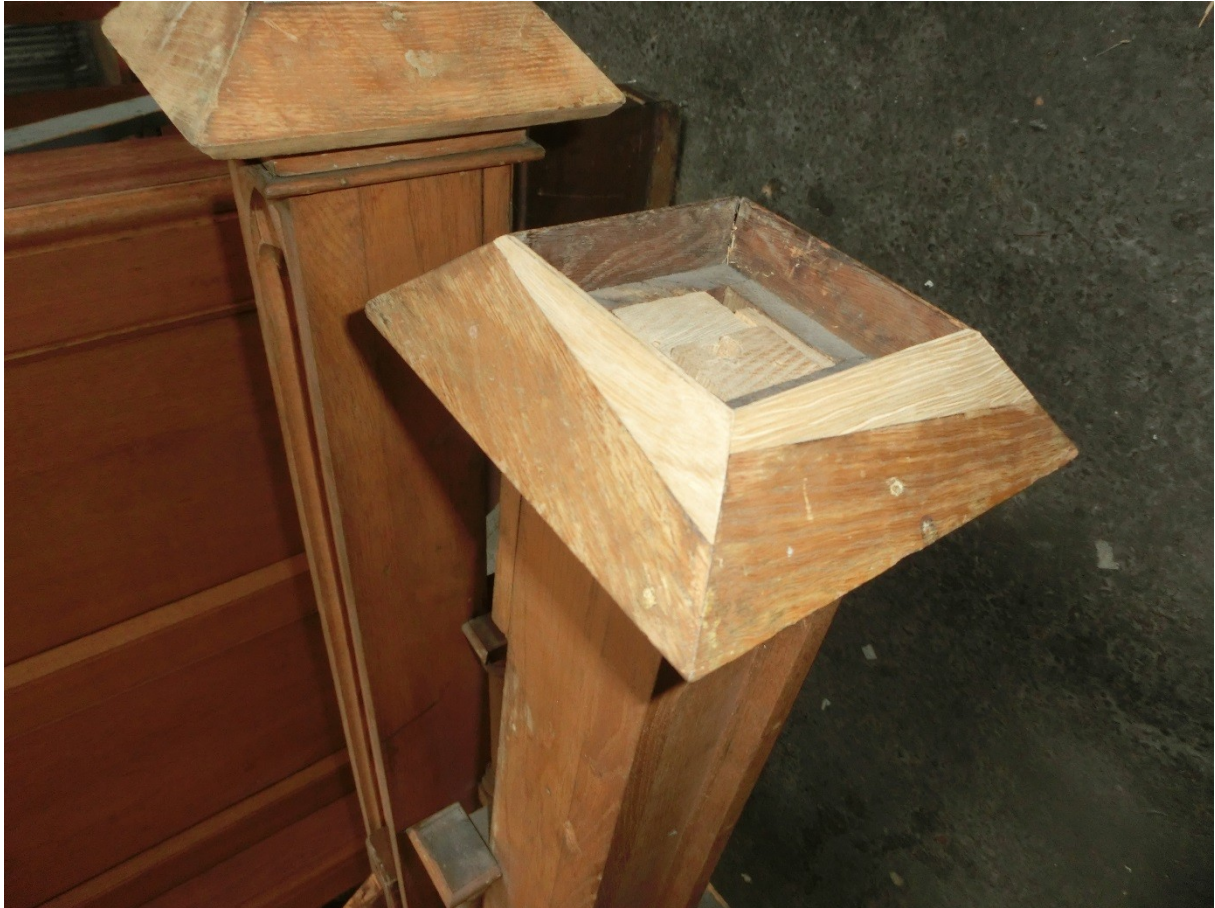
Ergänzungsarbeiten am historischen Orgelgehäuse