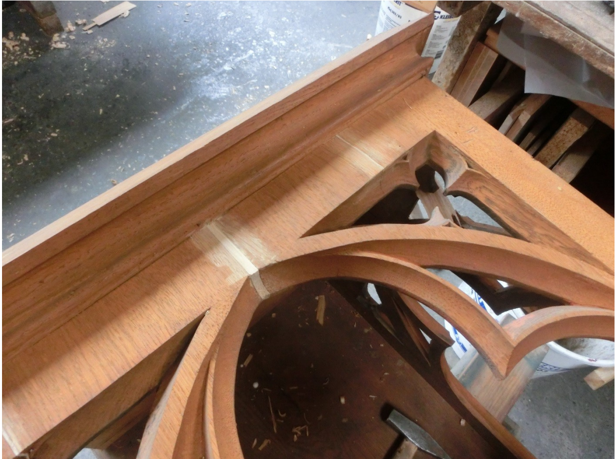
Ausspunden von Schwundrissen