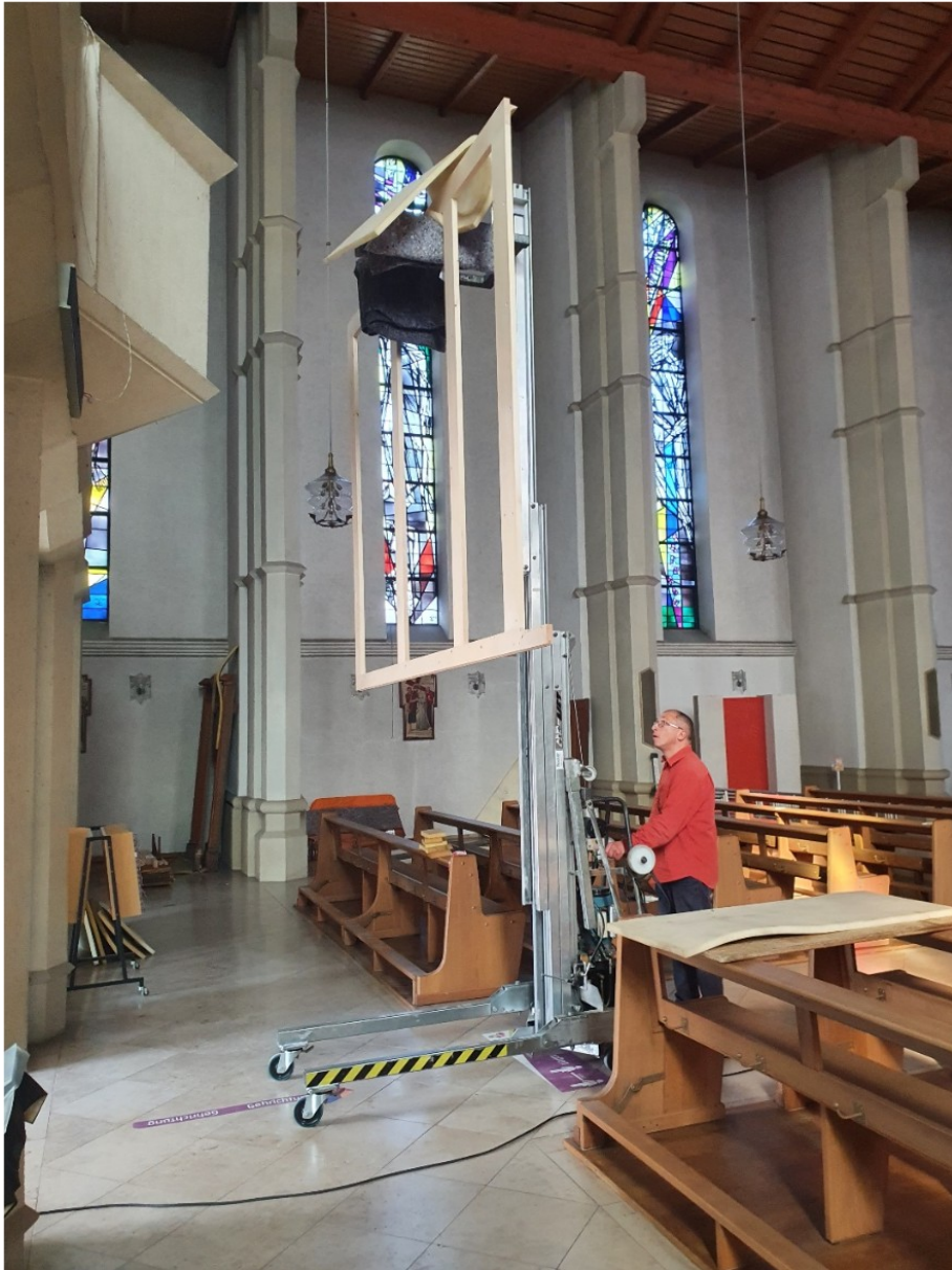
Aufbauarbeiten in der Kirche