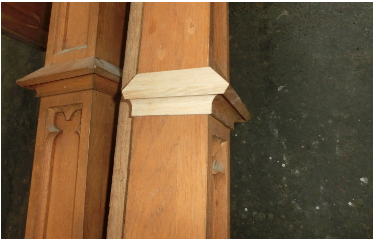
Ergänzungsarbeiten am historischen Orgelgehäuse