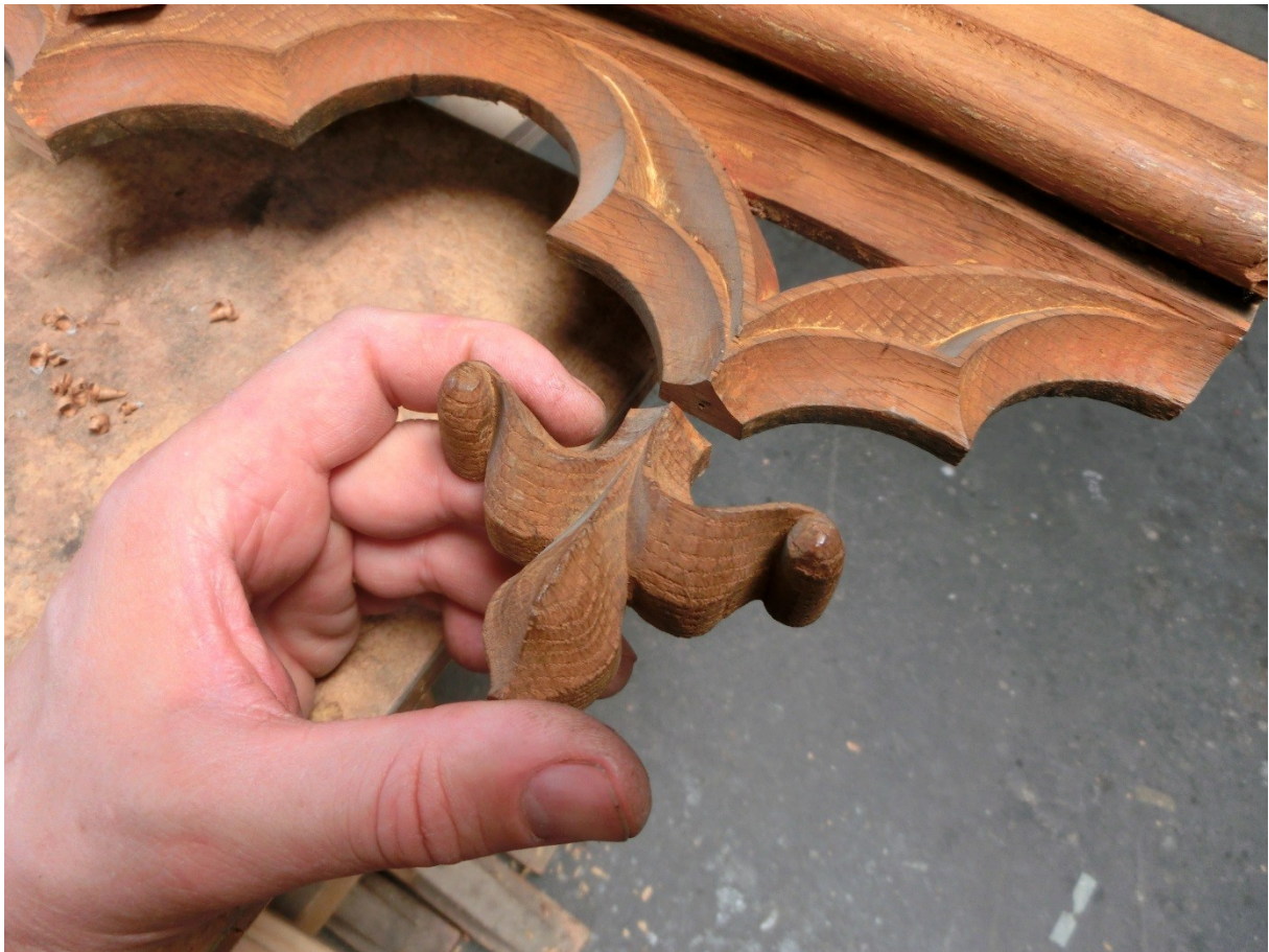
Restaurierungs- und Ergänzungsarbeiten am historischen Orgelgehäuse